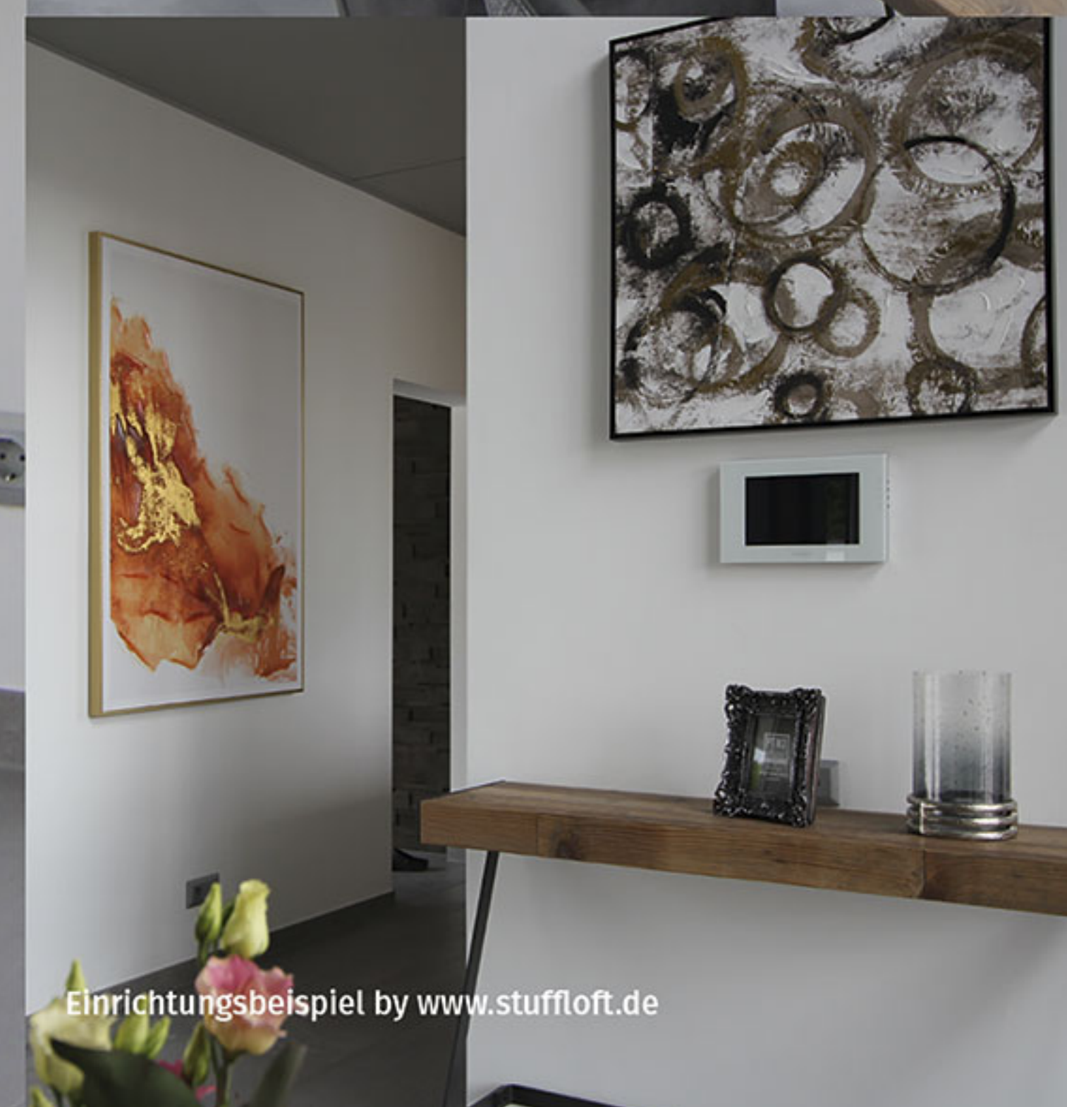
Einrichtungsbeispiel by www.stuffloft.de