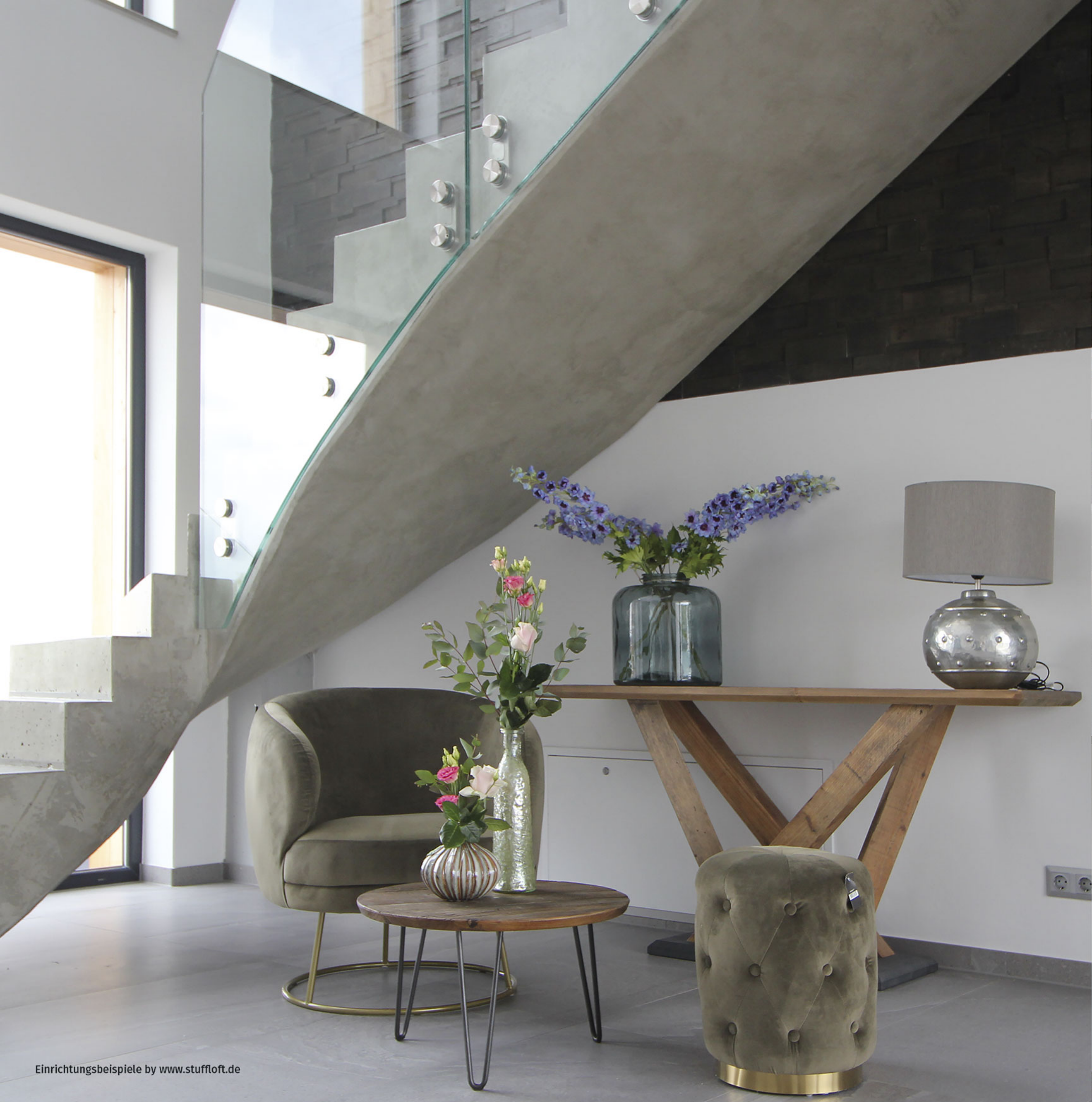
Einrichtungsbeispiele by www.stuffloft.de