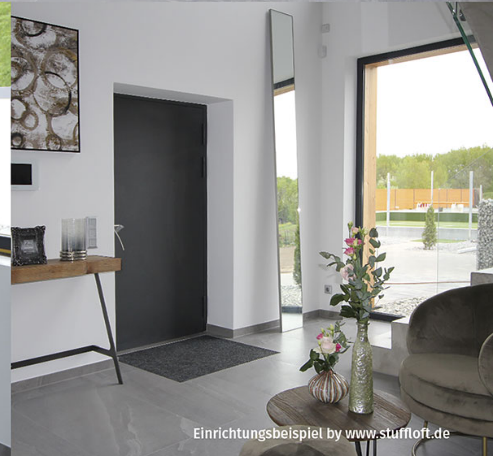
Einrichtungsbeispiel by www.stuffloft.de