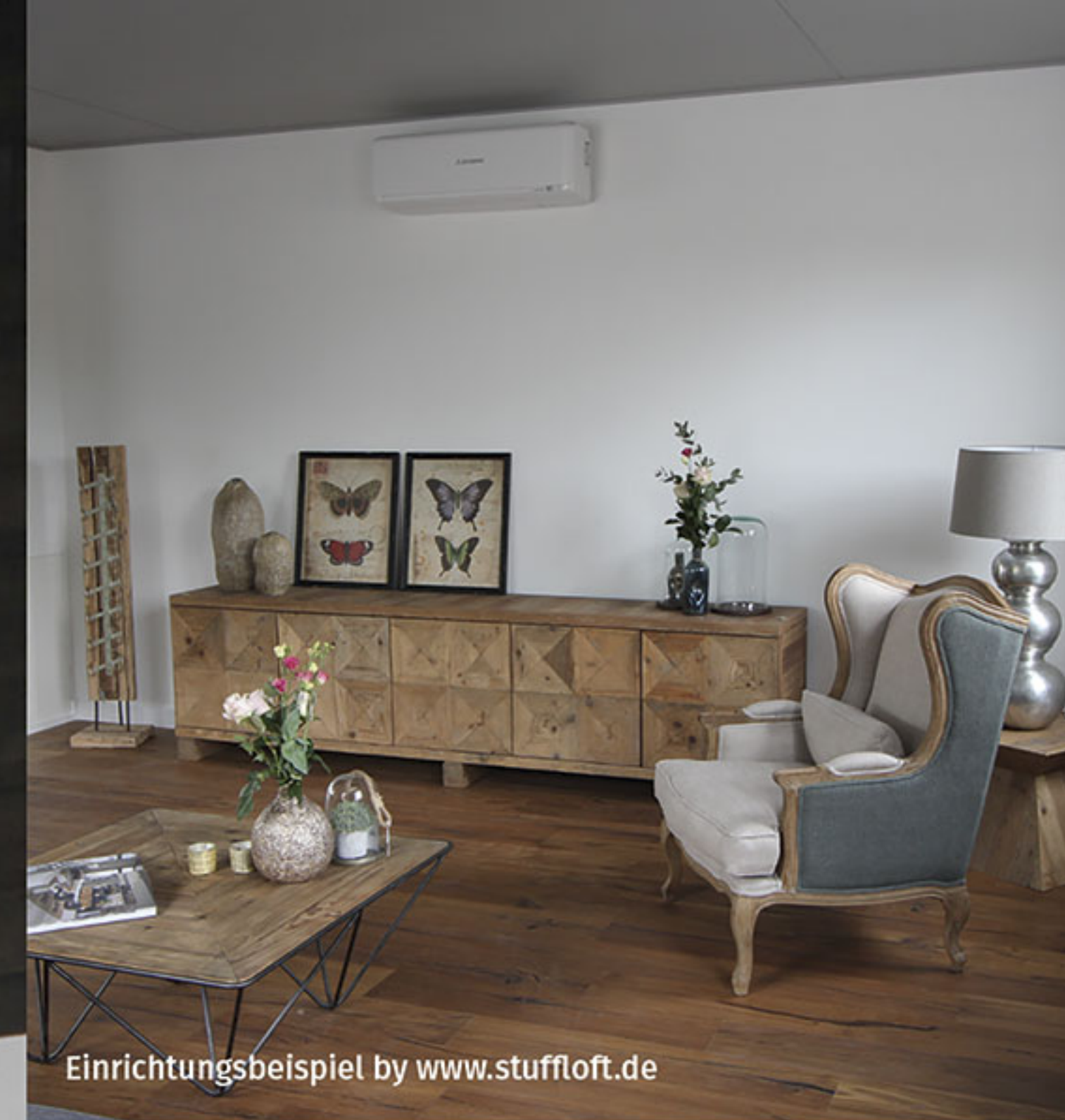
Einrichtungsbeispiel by www.stuffloft.de