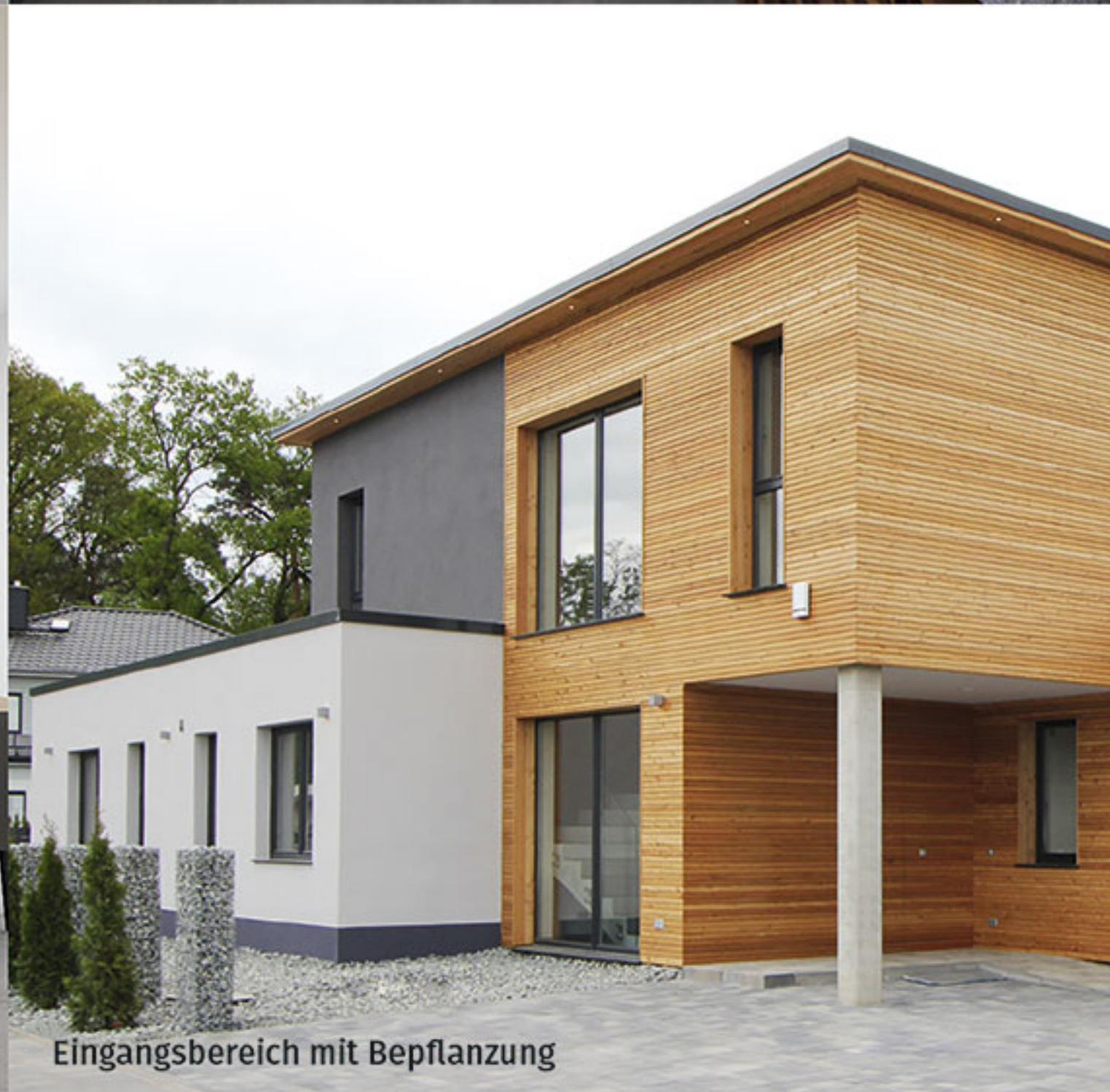
Eingangsbereich mit Bepflanzung