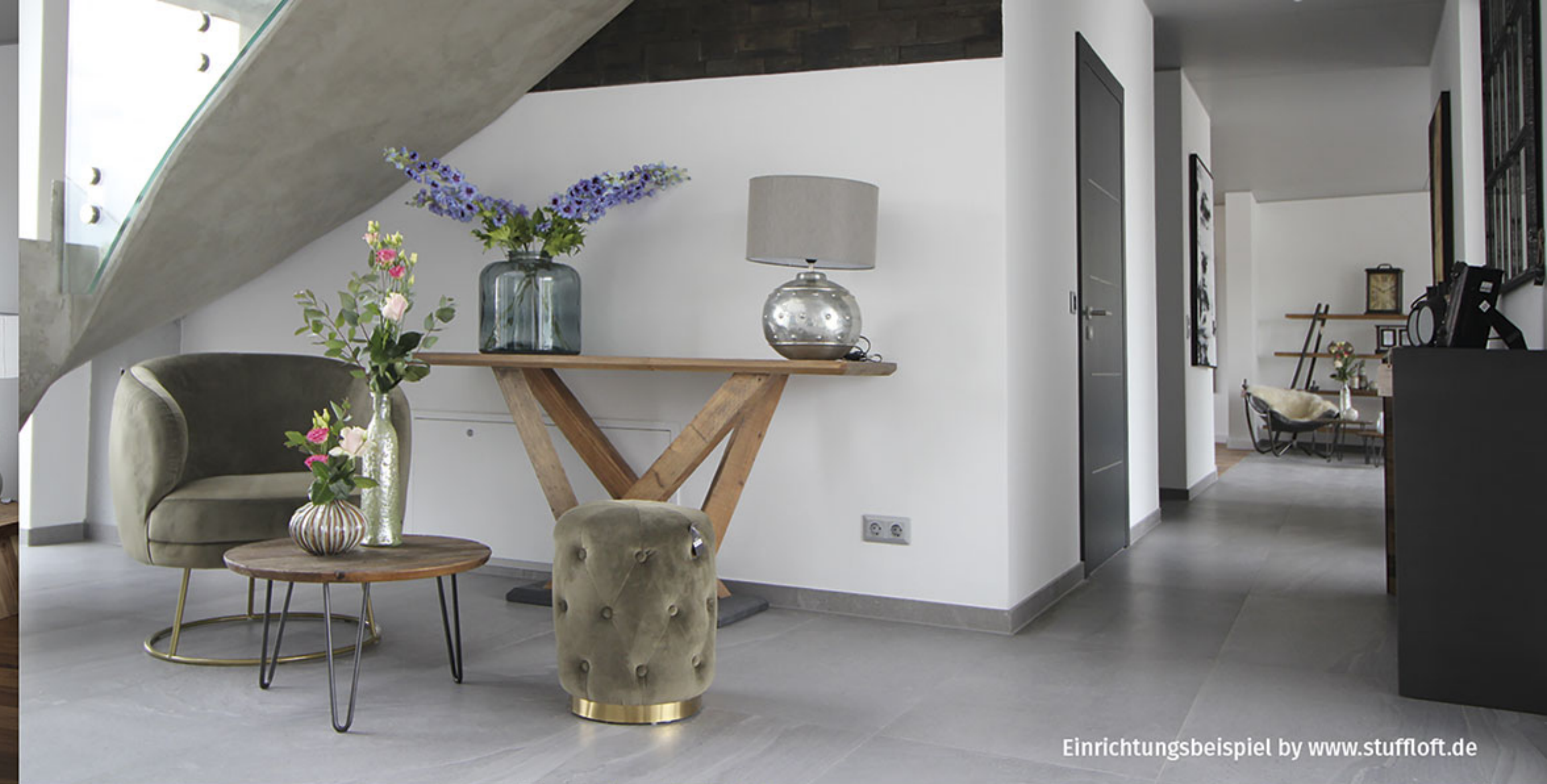
Einrichtungsbeispiel by www.stuffloft.de