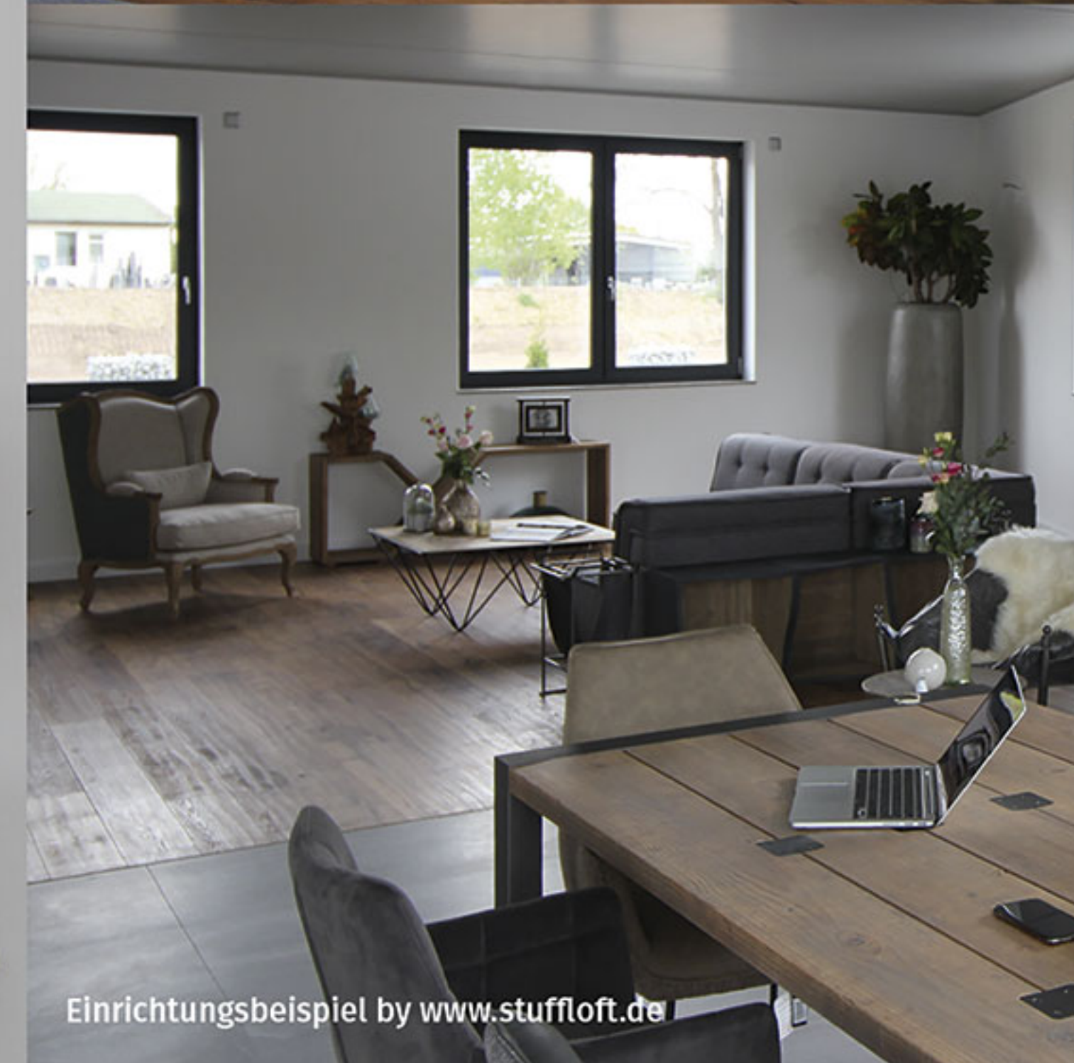
Einrichtungsbeispiel by www.stuffloft.de